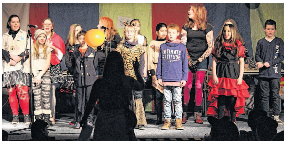
In der Gesamtschule Aldenhoven-Linnich ging's hoch her.