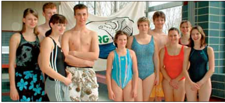
Neue Juniorausbilder verstärken das Ausbilderteam bei der Schwimmbildung.