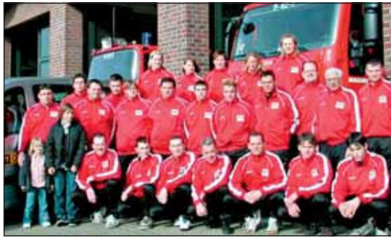
Erstmalig seit ihrem Bestehen ist die Mannschaft mit Trainingsanzügen der Firma CITY-CAR Linnich-Brachelen ausgestattet.