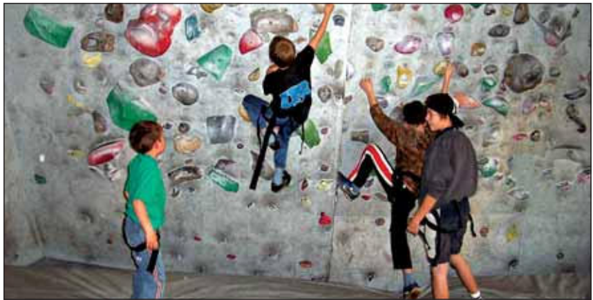
Die Jungschützen waren in diesem Frühjahr im Indoor Spielplatz in Bubenheim und verbrachten einen Samstagnachmittag mit Kettcar fahren, klettern, Trampolin springen und weiteren tollen Aktivitäten.

Damit alle Kinder an diesen Veranstaltungen teilnehmen können, entstehen für die Mitglieder der Schützenjugend keine Kosten. Ermöglicht werden die Ausflüge durch die finanzielle Unterstützung der Linnicher