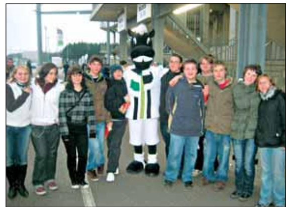
Die Kids vom Jugendtreff Gereonsweiler mit dem Maskottchen von Borussia Mönchengladbach: Jünter das Fohlen.