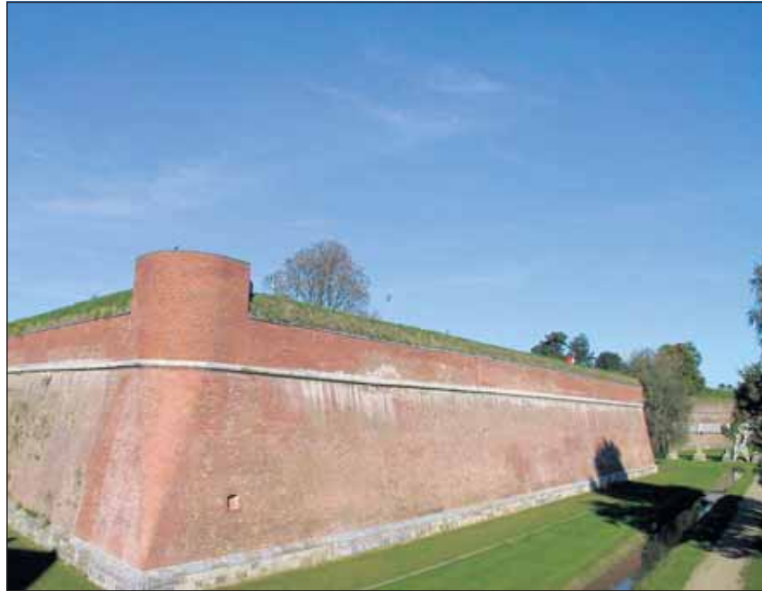
Die Wehranlagen der Zitadelle mit ihrem Konzept der „Rundumverteidigung“ sind ein Thema der GaSt-Führung am 6. Mai.

Die einst neuartige „Rundumverteidigung“ der italienischen Befestigungsmanier wird schon am historischen Stadtgrundriss sichtbar. Deutlich wird der Unterschied zu mittelalterlichen Wehranlagen, die „tote Winkel“ nicht vermeiden konnten. Südliches Ambiente und einzigartige, nur noch in Jülich erhaltene Architektur