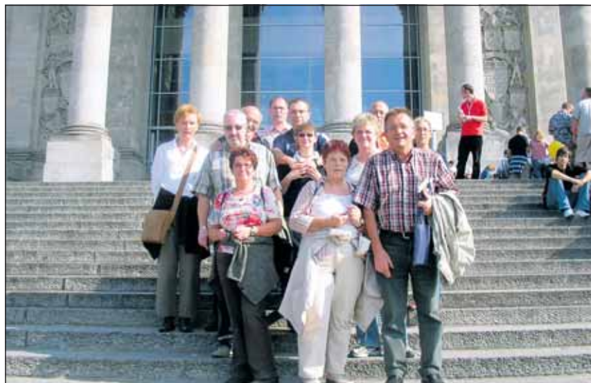
Gruppenbild vor dem Reichstag: Die Tetzter Berlin-Besucher genossen ihren Aufenthalt in der Hauptstadt.

Eine Voranmeldung ist nicht nötig; die Meldung der einzelnen Teilnehmer vor dem Start ist ausreichend. Der Start der einzelnen Teilnehmer einer Mannschaft muss nicht zusammenhängend an einem Tag erfolgen. Die Veranstaltung beginnt am Dienstag, dem 29. Mai 2007, und endet am Freitag, dem 1. Juni 2007. Meldebeginn ist jeweils um 17.30 Uhr - Meldeschluss um 20.00 Uhr. Eine Startgebühr wird nicht erhoben. Die Siegerehrung findet am Montag, 4. Juni 2007, um 17.00 Uhr im Festzelt statt. Der Eintritt hierzu ist frei. Die Schießmeister der Vereinigten Schützengesellschaften Linnich stehen jederzeit mit Rat und Tat zur Seite. Für Ihre Teilnahme bedanke ich mich im Namen der Vereinigten Schützengesellschaften recht herzlich.