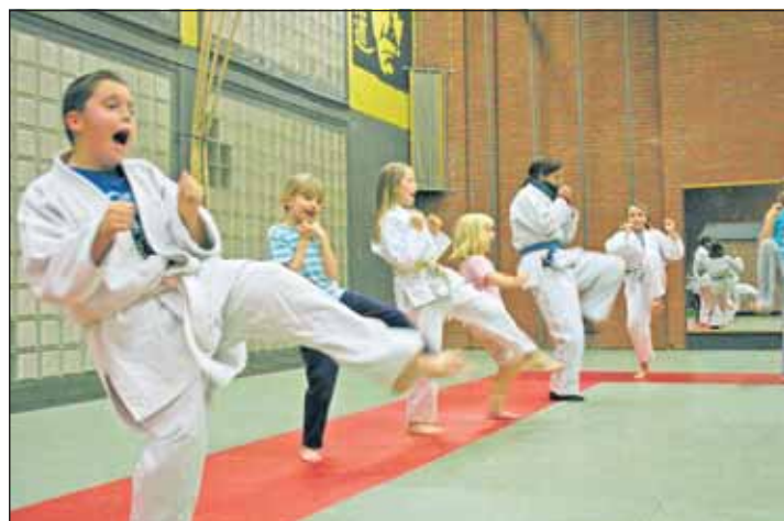
Rund 70 Kinder, Jugendliche und Erwachsene trainieren die uralte Kampfsportart. Das Jiu-Jitsu-Training findet donnerstags und freitags statt.