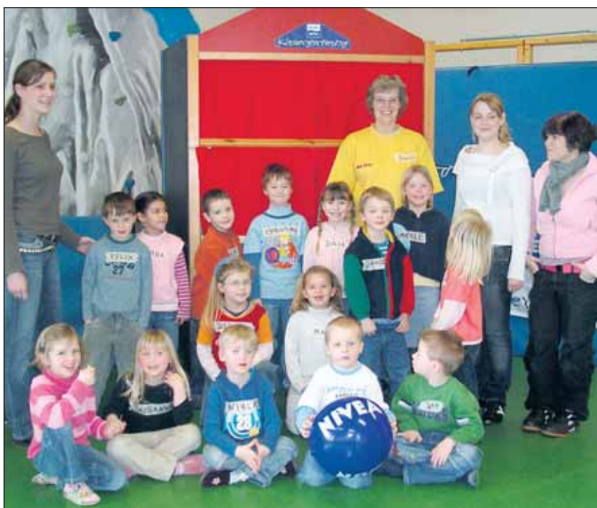
Die Kinder aus dem Kindergarten Schlingeltreff lernten bei fachkundigen DLRG-Mitarbeitern die wichtigsten Baderegeln.

Der Kreis Düren richtet in Zusammenarbeit mit der Fa. „Kramer, Zunft und Kurtzweyl“ am Samstag, den 12. Mai 2007 von 11.00 - 21.00 Uhr & Sonntag, den 13. Mai 2007 von 11.00 - 18.00 Uhr auf der Burg Nideggen ein mittelalterliches Burgfest aus. Unter dem Motto „Das Mittelalter kehrt zurück ins lebendige Museum“ wird dem Besucher der Alltag im Mittelalter durch verschiedene Marktstände, Handwerksvorführungen, Ritterlager und Ritterturnier für Kinder sowie Interessantes zur Waffenkunde, Weben und Filzen näher gebracht. Begleitet von Fanfaren, Puppenspiel, Gaukeleien und Zauberei bildet eine Licht- und Feuershow sicherlich den Höhepunkt des mittelalterlichen Treibens. Eintrittspreise: Erwachsene: 3,00 € Kinder bis Schwertmaß (1,38 m): frei Kinder bis 18 Jahre: 1,50 € Mittelalterlich Gewandete: frei