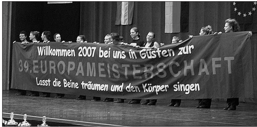
2006 luden die Güstener Funken auf der letzten Euro in Landshut alle Aktiven und Interessierten nach Güsten ein.

Der Güstener Verein, dessen 33 Tänzer/innen sich jedes Jahr national und international erfolgreich behaupten, ist erstmals Veranstalter eines derart großen Ereignisses und hofft auf reges Interesse in der Bevölkerung. Als Schirmherr konnte Landrat Wolfgang Spelthahn