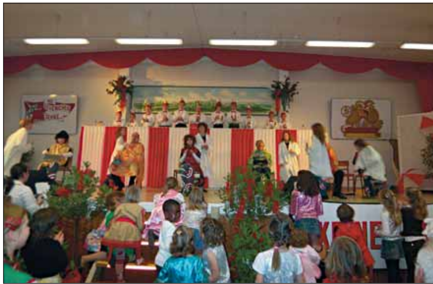
Spaß auf und vor der Bühne: Die Kindersitzung der KG Gevenicher Jekke.