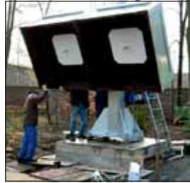
Aufbau einer Großkaliber-Vogelschussanlage in Beckum.

Eigens informierte man sich kürzlich direkt vor Ort bei der Herstellerfirma Thorwesten in Beckum. Bei der Besichtigung des Aufbaus einer dortigen Vogelschuss-