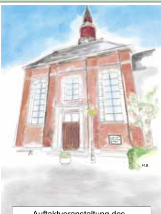
Auftaktveranstaltung des Linnicher Kultursommers am 5. Mai von 15 bis 17 Uhr

Café und Musik im Gemeindegarten der Evangelischen Kirche Linnich