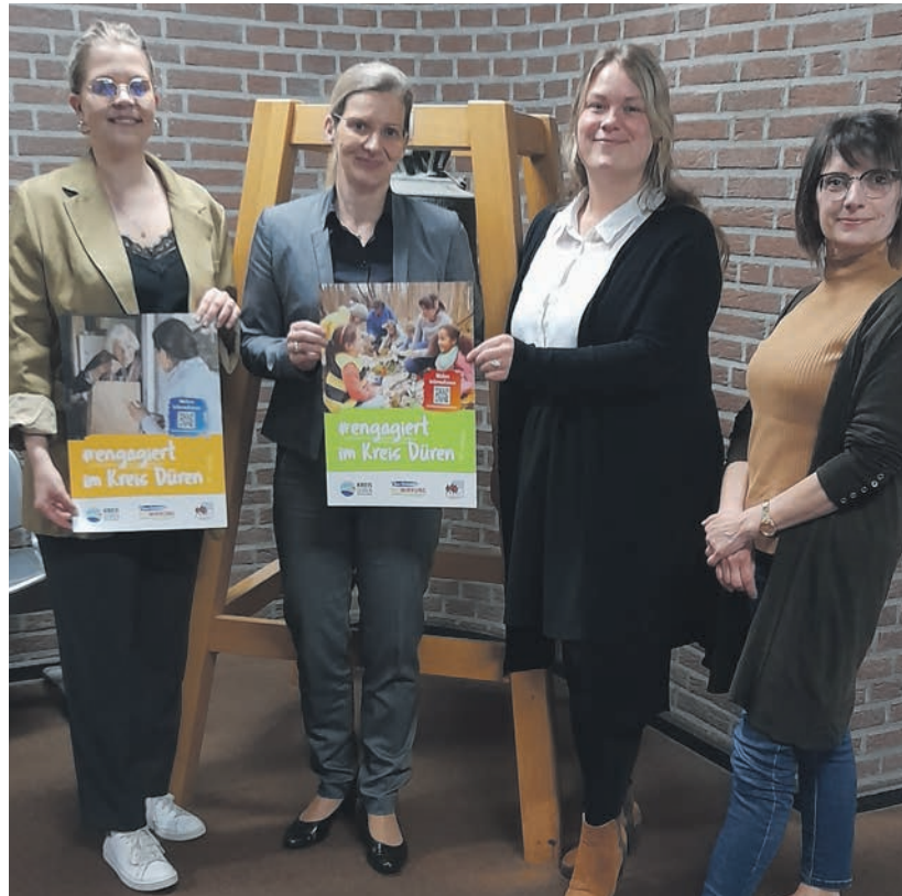
Thema Ehrenamt für das gesamte Kreisgebiet im Rahmen einer „Ehrenamtsakademie“ umgesetzt. Diesbezüglich wird in Kürze eine

Ein erster Umsetzungsschritt war die Einrichtung und Eröffnung der Kontakt- und Anlaufstelle „Dein Ehrenamt. MITWIRKUNG.“ in Kooperation mit dem Freiwilligenzentrum Düren e.V. als ein kreisweites Angebot zum 1. Januar 2022. Ein weiterer Schritt in der Umsetzung des Konzeptes beinhaltet den Aufbau einer digitalen Plattform. Zum 1. Oktober 2022 wurde die Ehrenamtsbörse unter kreis-dueren.de/ehrenamt veröffentlicht. Darüber hinaus werden aktuell gemeinsam mit verschiedenen Akteur*innen aus dem Kreis Düren Qualifizierungsmaßnahmen zum