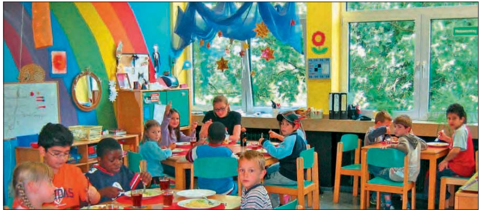
In der Offenen Ganztagschule Linnich kann man zwischen den Betreuungsformen „Mittag“ und „Ganztag“ wählen. Gastkinder sind jederzeit herzlich willkommen.

Bis 08.15 Uhr haben die Kinder Gelegenheit zu einem Frühstück und Zeit für Freispiele, ab 08.15 Uhr – 13.15 Uhr finden die Unterrichtsstunden von der 1. bis zur 6. Stunde statt. Hausaufgabenbetreuung und dazu parallel Freispielmöglichkeiten werden angeboten, sofern die Kinder früher Schulschluss haben. Das Mittagessen für die Ganztagskinder findet von 13.15 Uhr – 14.00 Uhr statt. Hausaufgaben- / Intensivbetreuung wird nach dem Essen durch OGS - Mitarbeiterinnen/Lehrkräfte angeboten. Nachmittags-Angebote aus verschiedenen Bereichen können von 15.00 Uhr – 16.00 Uhr genutzt