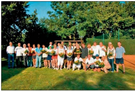
Traditionelles Turnier am Bendenweg zugunsten der Aids-Hilfe.