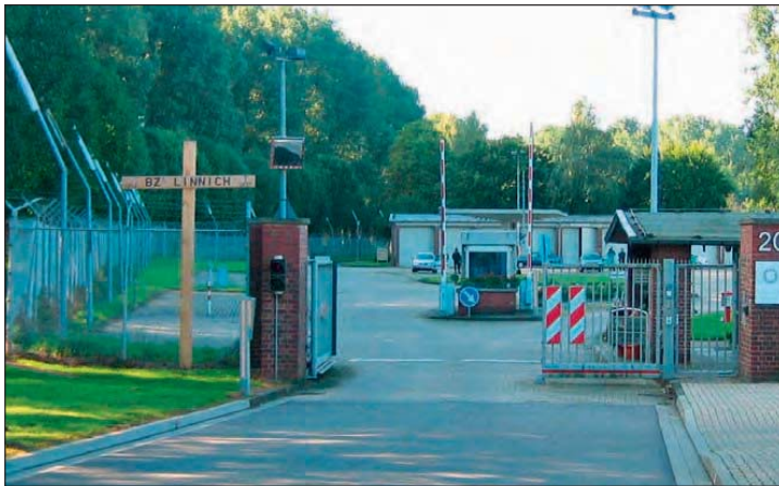
Abschied der 14. Hundertschaft von der BPA in Linnich nach 55 Jahren.