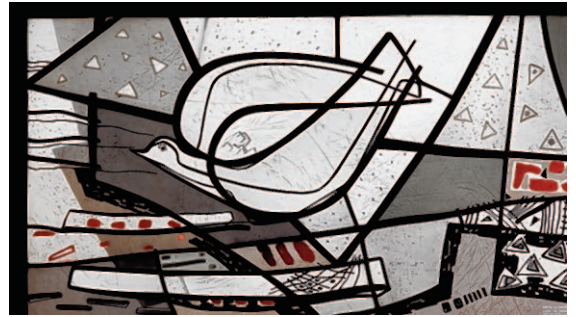
Foto: Maria Katzgrau - Die Heilige Dreifaltigkeit (Ausschnitt) Foto: Stefan Johnen

Termine: 2. Februar („Eulen“), 2. März (Materialcollage auf Glas), 4. Mai (Herz-Bilderrahmen), 1. Juni (Kunterbunte Gläser), 6. Juli (Schmuckgestaltung), 5. Oktober (Schmuckgestaltung) und 7. Dezember (Engel – weihnachtliche Boten – Kreide) 2013, jeweils 11 - 13 Uhr, mit Ausnahme der Schmuckkurse: 10 - 13 Uhr Leitung: Dorothea Gerards / Helga Berendsen