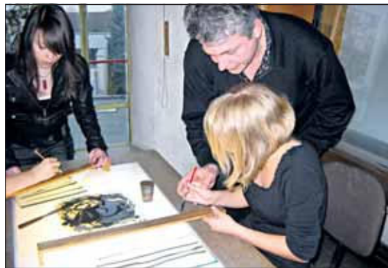
Die Schüler waren begeistert bei der Arbeit.

zu üben. Gegen 16 Uhr ging es dann zur Besichtigung des