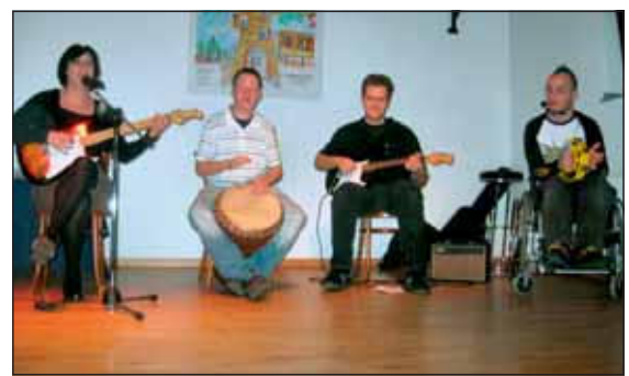
Die Stammhaus-Band „The Authentics“ eröffneten das Konzert.

Das 5. Benefiz-Konzert am 17.11. in Gevelsdorf war ein toller Erfolg im restlos ausverkauften Pfarrsaal in Gevelsdorf. Nicht nur das über 1100 € für das Stammhaus Jülich und Vive-te Jülich erwirtschaftet werden konnte, nein die tollen Stimmen und das tolle Programm des a cappella Chores „CANTIGA“ aus Aachen begeisterte im restlos ausverkauften Pfarrsaal das Publikum. Schade für die ca. 50 Personen die leider keine Karten mehr bekommen konnten. Stehende Ovationen und Rufe nach Zugabe zeigten die Musik hatte mitten ins Herz der Besucher getroffen. Die acht Mitglieder des a cappella Chores zeigten nicht nur gesangliche Meisterleistungen, sondern spendeten auch noch reichlich von ihrer Aufwandsentschädigung und dies obschon beim Lied „Wat'n herrliches Kölsch“, neu getextet zu Louis Armstrongs-Welthit „What a wonderful world“, auf der Bühne nur Pils gereicht werden konnte.