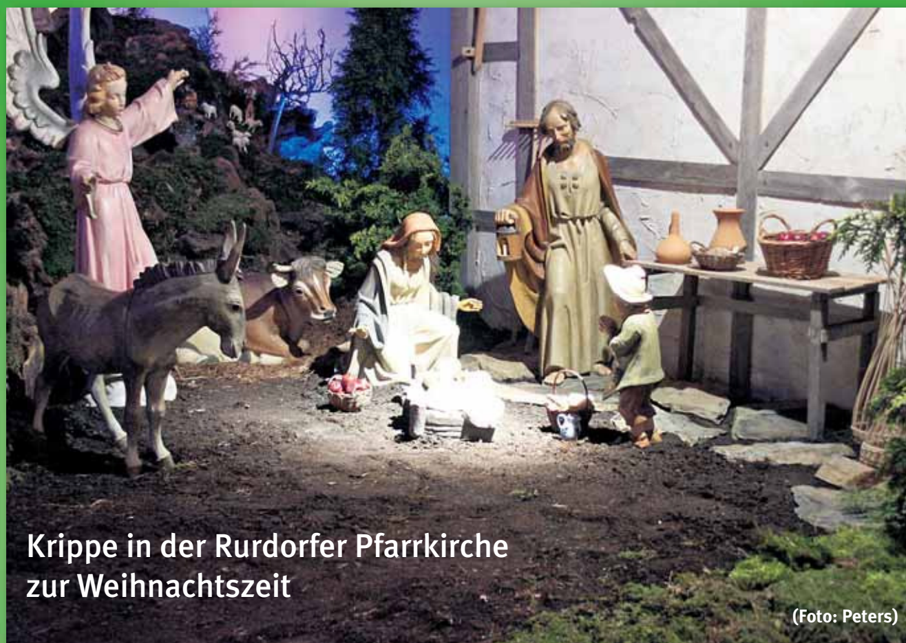
Krippe in der Rurdorfer Pfarrkirche zur Weihnachtszeit

Boslar – Ederen – Floßdorf – Gereonsweiler – Gevenich – Glimbach – Hottorf – Kofferen – Körrenzig – Linnich – Rurdorf – Tetz – Welz