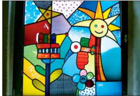
Das von den Schülern der Schule für Sehbehinderte in Duisburg gestaltete Glasbild.

Nach einer kurzen Begrüßung im Rathaus Linnich durch Bürgermeister Wolfgang Wittkopp ging es zu