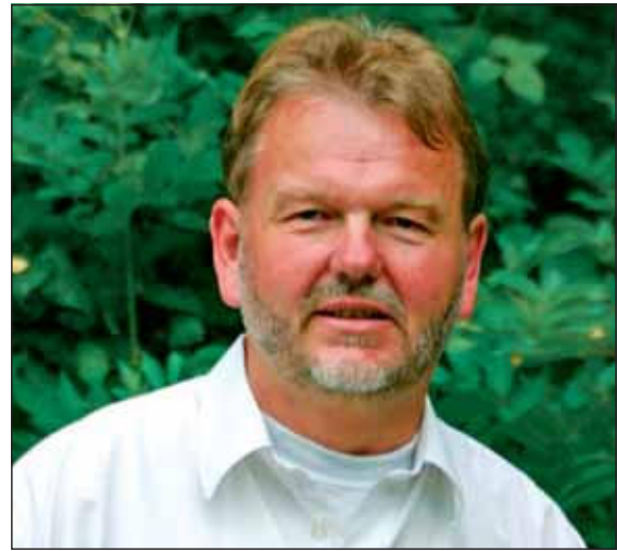
Bürgermeister Wolfgang Wittkopp

sche Kinderschutzbund hat mit der Stadt und den Schulen das Programm entwickelt. Wir hoffen gemeinsam auf die Fertigstellung des neuen Gebäudekomplexes im Jahr 2008. Dann kann dieses Angebot sicher noch attraktiver gestaltet werden. Ebenso auf kulturellem Gebiet können wir uns Ende des Jahres 2007 an erfreuliche Ereignisse erinnern. Zahlreiche Vorstellungen im Theater Mönchengladbach wurden im Rahmen der Theaterfahrten der Stadt Linnich besucht. Die Programmaktivitäten der Gleichstellungsbeauftragten waren wenige Stunden nach Anmeldebeginn bereits ausverkauft. Mitte September führte die zweite Linnicher Kulturwoche zahlreiche Künstlerinnen und Künstler aus der Region und ein interessiertes Publikum zusammen. Viele Menschen zeigten Interesse für ein buntes mannigfaltiges Programm und genossen die Darbietungen mit offenen Augen und Ohren. Kurz vor Weihnachten beeindruckten wieder Krippen