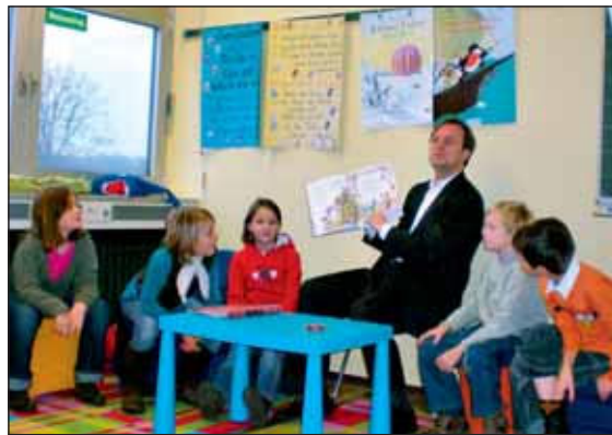
Gespannt hörten die Kinder der Gemeinschaftsgrundschule Linnich dem Parlamentarischen Staatssekretär im Bundesbildungsministerium Thomas Rachel zu.

Thomas Rachel brachte eine Geschichte von Pettersson und Findus zum Vorlesetag