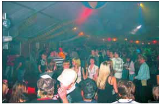
Die Partys im Welzer Festzelt werden wie immer ein Knaller werden.

Am Altweiber, 31. Januar '08, geht es weiter mit unserer weitbekanntesten Altweibersause. Dann ist wieder „Ausnahmestandard“ in unserem kleinen Dorf. Beginn ist um 16 Uhr. Happy Hour ist von 17 bis 19 Uhr: Zwei Getränke zum Preis von einem, z.B. Pils vom Fass (0,2l) = 50 Cent! Extra für euch: Busverbindung von