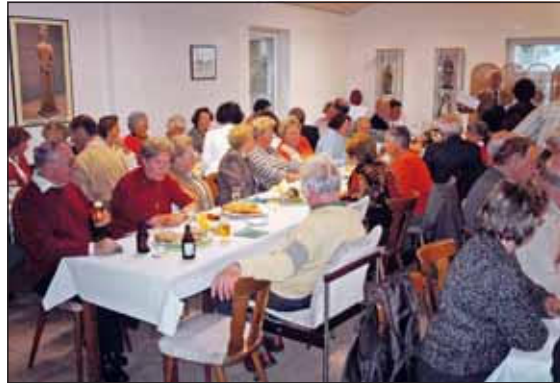
Blick in die Runde.