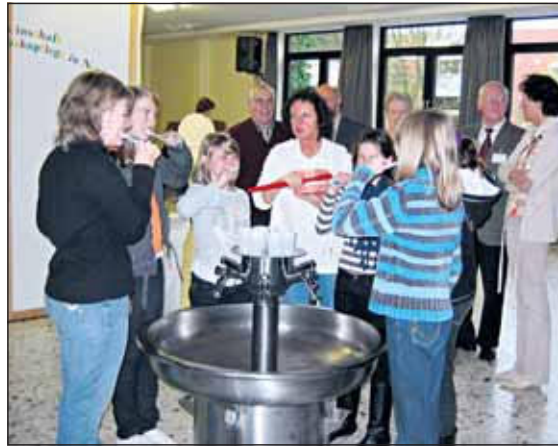
Am Zahnputzbrunnen wurde das erworbene Wissen vertieft.

Eingeladen waren zusammen mit ihren LehrerInnen die Kinder der Klassen fünf und sechs der Real- und Hauptschule sowie die Klasse vier der Grundschulen, um sich über richtige Zahnpflege zu informieren. Rund 380 Kinder sind gekommen.